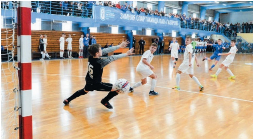
Юноши команды Екатеринбурга (в синем) в драматичном финале переиграли Югорск

В начале второго тайма мячом больше владели сургутяне. Ребята искали подходы к воротам соперника, заходили с флангов, пытались исполнить длинные передачи, но безрезультатно. Игра шла аккуратная, вдумчивая, парни практически не фоллили – за первую десятиминутку было зафиксировано всего одно нарушение.